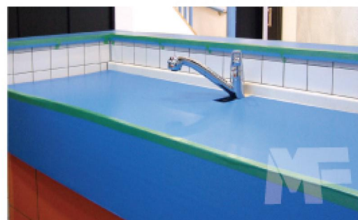
用于厨房周围的防护