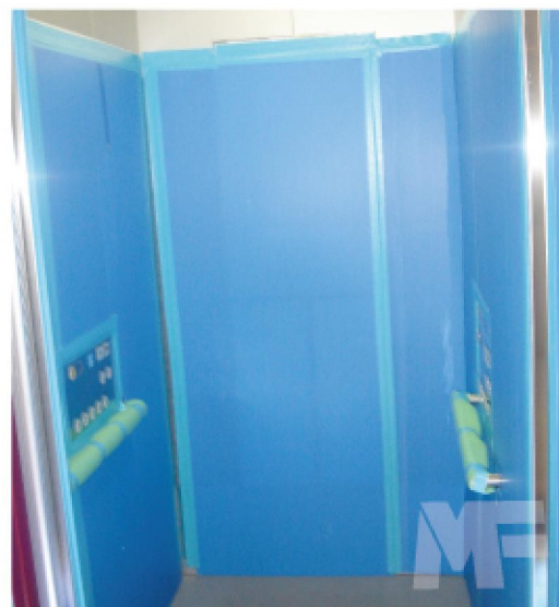
用于电梯的壁面防护